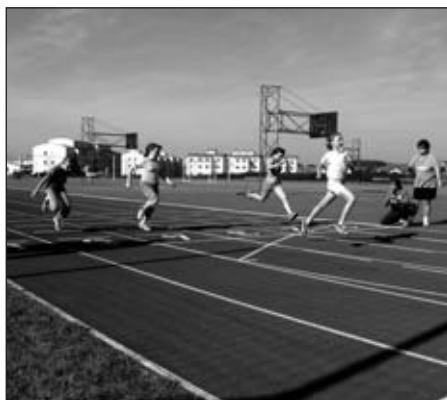
Mladší ročníky pak soutěžily v trojboji, sestávajícího z běhu na 50 m, skoku dalekého a hodů kriketovým míčkem. V individuální

klasifikaci získali všechna prvenství žáci ZŠ Holubova: