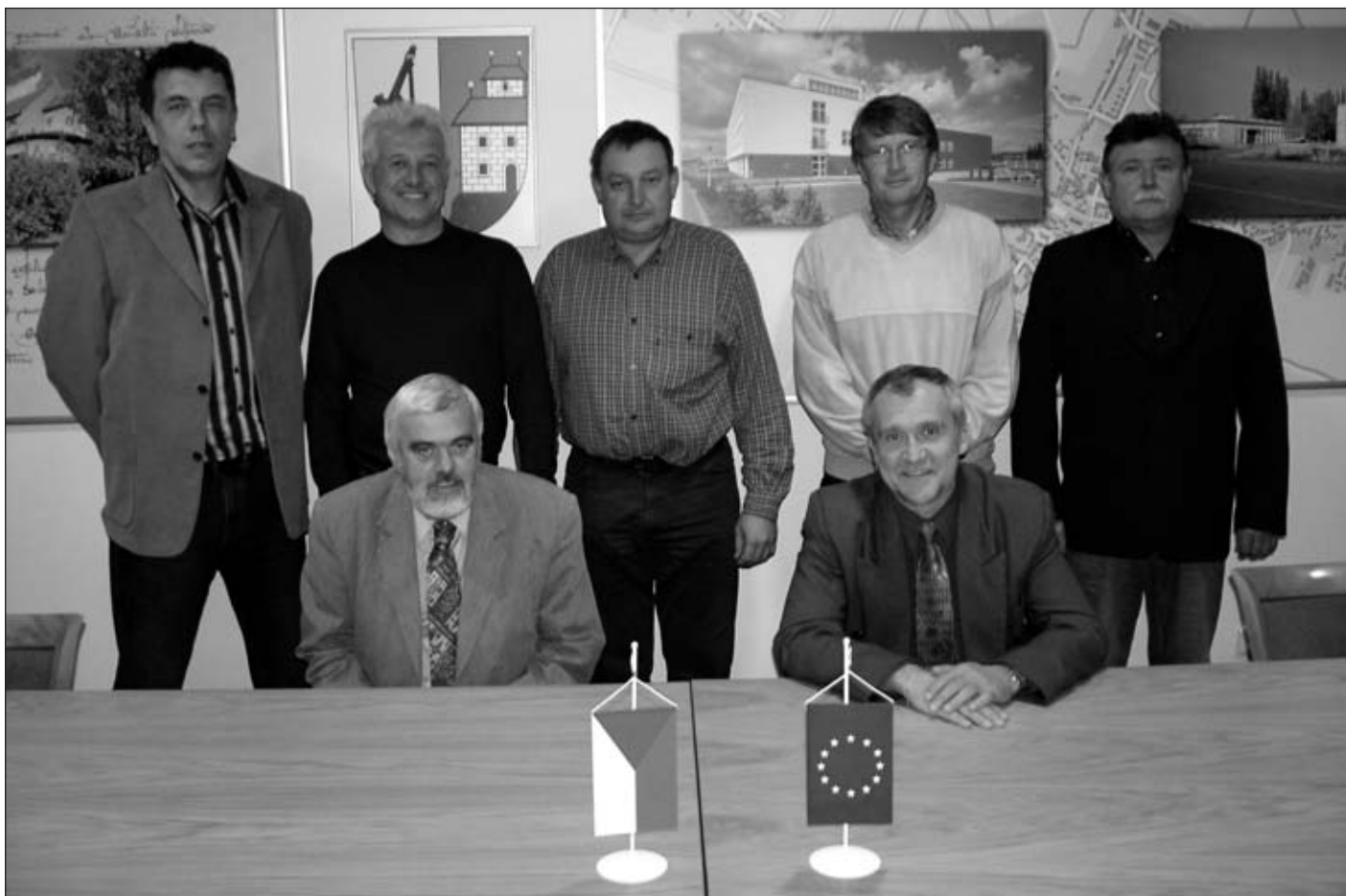
Rada města ve volebním období 2002 – 2006.

Srdečně zveme občany na ustavující zasedání zastupitelstva města Holic pro volební období 2006 – 2010.