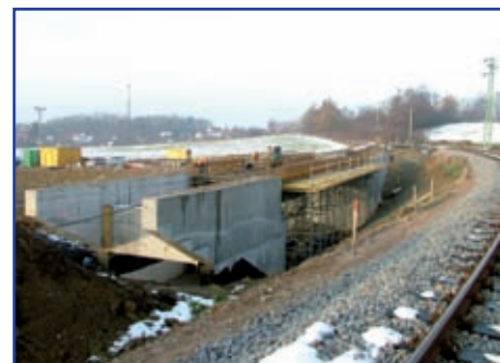
Přemostění železniční tratě pod hřbitovem