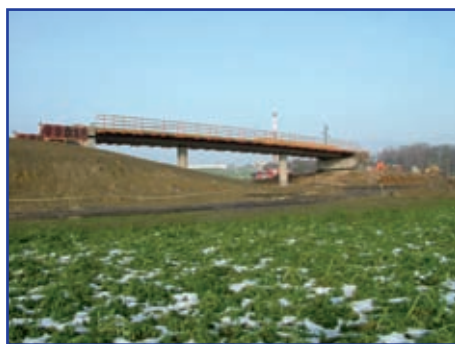
Most na silnici do Roveňska

Smluvní termín dokončení stavby: 30. 10. 2008