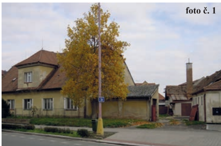
foto č. 1

Hradecká č. p. 59 (foto č. 1) – v současné době došlo k přestěhování nájemníků z prostor, které již nevyhovovaly pro důstojné bydlení. Nově našli pronájem hned ve vedlejší budově bývalé Lidové školy umění v Husově ulici. Tato budova prošla rekonstrukcí, aby noví nájemníci především z řad sociálně slabších měli bydlení, které z hlediska hygienických norem odpovídá současné době. Díky dotaci na rekonstrukci „59“ zaplatí město pouze 10 % z celkové částky 10 milionů, které jsou potřeba na stavební práce. Vznikne zde 8 nových malometrážních bytů, které by v budoucnosti měly sloužit např. samoživitelkám a starším občanům. Byty by měly být velikosti 1 + kk (3 byty) a 2 + kk (5 bytů). Pokud vše půjde podle plánu, tak k 31. 7. 2018 by měla přestavba „59“ být hotova.