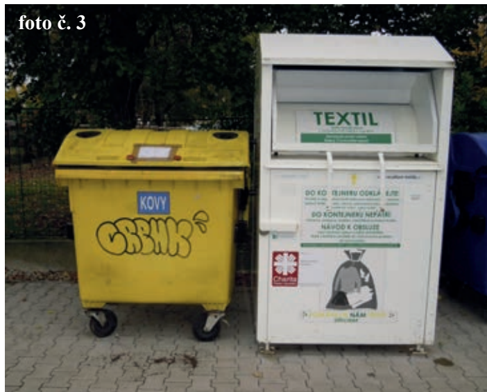
foto č. 3

V poslední době zaznamenáváme, že místní „výtvarníci“ pomalovávají kontejnery, dopravní značky a fasády domů. Je smutné, že se tyto lidé neštítí poškozovat veřejný majetek, který je majetkem nás všech. Odstranění těchto malůvek je nákladné a jde z rozpočtu města. Za ty peníze by potom mohlo být něco užitečnějšího.