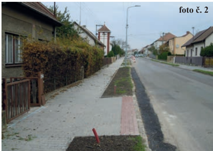
foto č. 2

Kontejnery a místní „výtvarníci“ (foto č. 3) – Postupně se sice lepší třídění odpadů do jednotlivých kontejnerů, ale pořád je dluh některých občanů, kteří cokoliv dají do kontejnerů, do kterých to nepatří. Svoz je potom zbytečně dražší, protože TS musí potom tyto věci odvážet extra na sběrný dvůr a účty za odpady tak zbytečně narůstají. Velkým problémem jsou kontejnery na textil. Pracovníci svozu hodnotí naše město jako nejhorší. Textil lidé nedávají do igelitových pytlů a klidně do tohoto kontejneru dají např. zbytky jídla a tím celý obsah kontejneru znehodnotí. Přitom by např. oblečení ještě mohlo sloužit potřebným lidem.